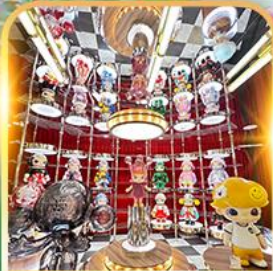
POP MART ชิเหมินตง