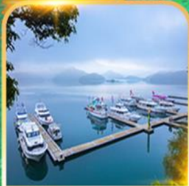
ทะเลสาบสุริยอันตรา