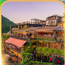
หมู่บ้านจิวเฟิ่น