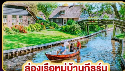
ล่องเรือหมู่บ้านกังหัน