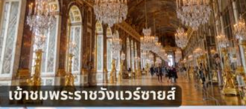
เข้าชมพระราชวังแวร์ซายส์