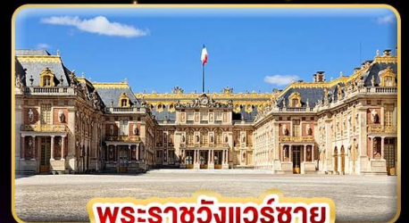
พระราชวังแวร์ซาย