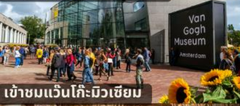
เข้าชมแวนโก๊ะมิวเซียม