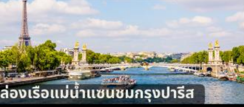
ล่องเรือแม่น้ำแซนชมกรุงปารีส