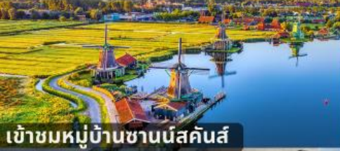
เข้าชมหมู่บ้านชานีส์คันส์