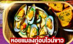
หอยแมลงภู่นิวอิงชาว