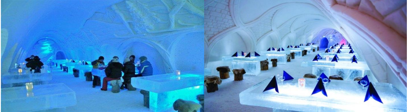
เที่ยง บริการอาหารกลางวัน ณ ภัตตาคาร

*** นำท่านเข้าชมภายในภัตตาคารน้ำแข็ง “SnowExperience365” ซึ่งเปิดบริการตลอดทั้งปี ภายในจะมี ประติมากรรมน้ำแข็งที่น่าทึ่ง ให้ท่านได้เพลิดเพลินกับเครื่องดื่มพร้อมนั่งถ่ายรูป กับโต๊ะอาหารน้ำแข็งที่ ล้อมรอบด้วยรูปปั้นที่สวยงาม และแก้วที่ใช้เสิร์ฟเครื่องดื่ม จะทำจากน้ำแข็งภายใต้อุณหภูมิลบห้าถึงลบสิบ องศาเซลเซียสแม้ในช่วงกลางฤดูร้อน”