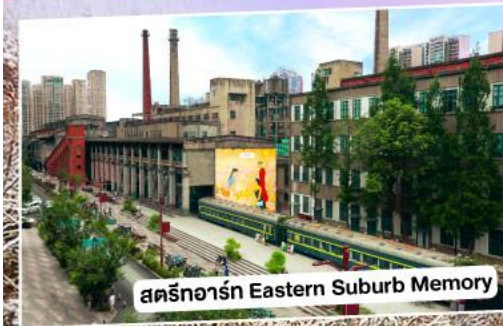
สตรีทอาร์ต Eastern Suburb Memory