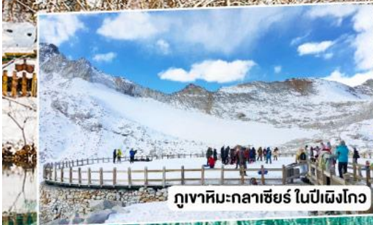
ภูเขาหิมะกลาเซียร์ ในปี่ผิงโกว