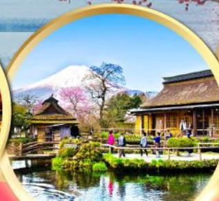
หมู่บ้านน้ำใสโอชิโนะฮักโกะ