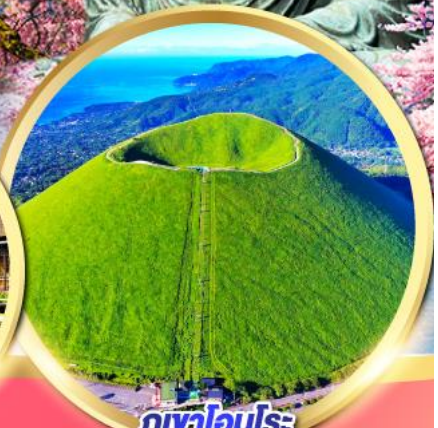
ภูเขาโอโมรูโระ