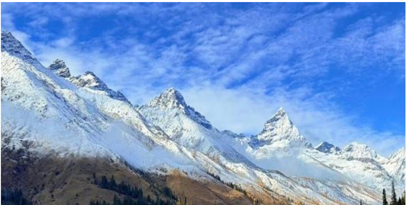
G01TFU-CA300 เฉิงตู สี่ตฺรุณี ปี่ผิงโกว จิวจ้ายโกว(นั่งรถไฟความเร็วสูง) * ไม่ลงร้านช้อปปิ้ง * โดยสายการบิน Air China (CA)

เช้า รับประทานอาหารเช้า ณ ห้องอาหารภายในโรงแรม (มื้อที่ 1)