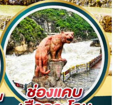
ช่องแคบ เสือกระโจน