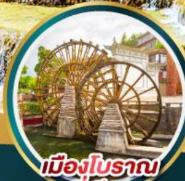
เมืองโบราณ ลี่เจียง