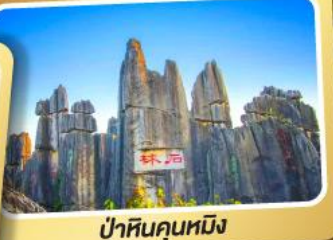
ป่าหินคุณหมิง