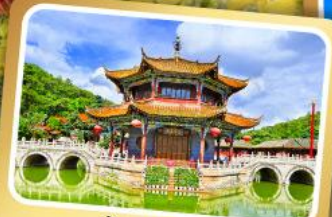
วัดห้วยวนกง