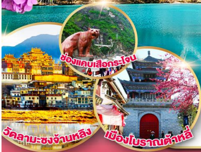
ช่องแคบเสื่อกร-โง