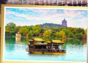
ล่องเรือทะเลสาปซีหู