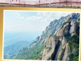
เทวหลิงซาน