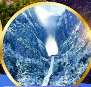
ประติมากรรม หิมะหมื่นต้น