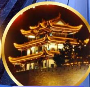
หอคอยทองคำเทียนซิน