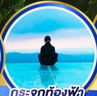
กระจกท้องฟ้า เจาหลิงซาน