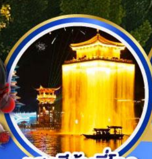
แสงสีอันน่าทึ่ง