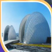
โรงละครหอยโขง