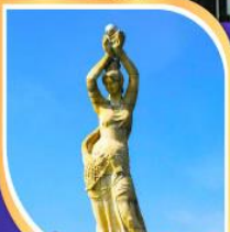
จูไห่พิซเซอร์รี่