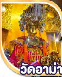
วัดอาน่า