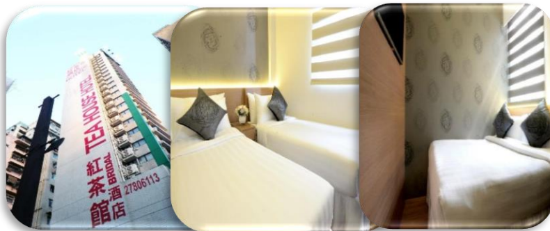
WE HOTEL โรงแรมระดับ ☆☆☆