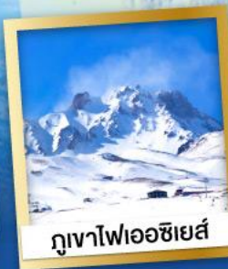
ภูเขาไฟเออซิเยส์