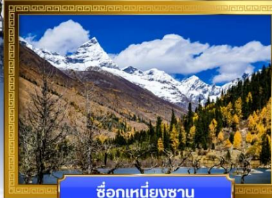
ชื่อกุเหนียงชาน