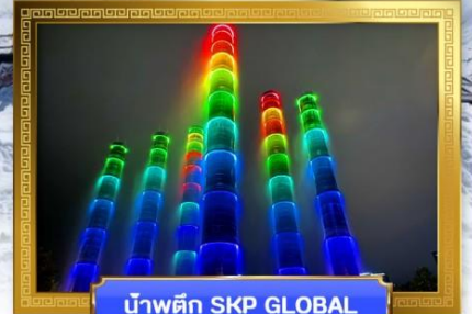
น้ำพุตึก SKP GLOBAL