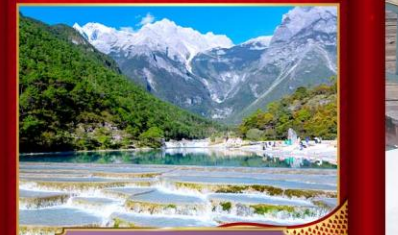
ทะเลสาบไป๋สฺยเหอ