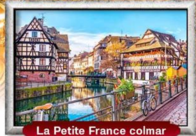
La Petite France colmar

บินหรู สายการบิน Full Service | พิเศษ! หอยแอสคาโก้