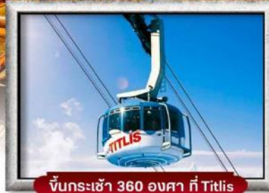
ขึ้นกระเช้า 360 องศา ที่ Titlis