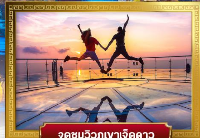
จุดชมวิวกูเขาเจ็ดดาว