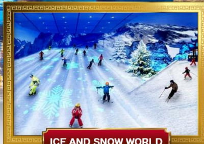
ICE AND SNOW WORLD