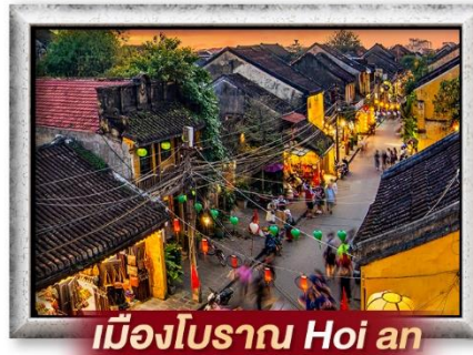
เมืองโบราณ Hoi an