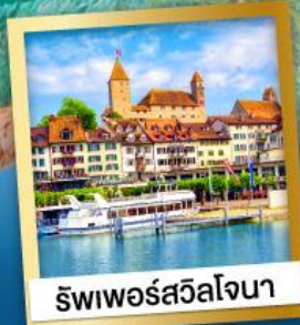
ริวาเพอร์สวิลโจนา