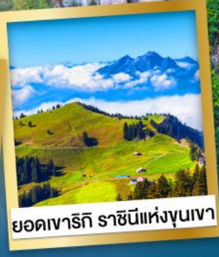
ยอดเขาจริก ราชนีแห่งขุนเขา