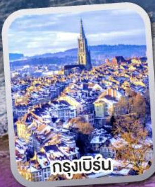
กรุงเบิร์น