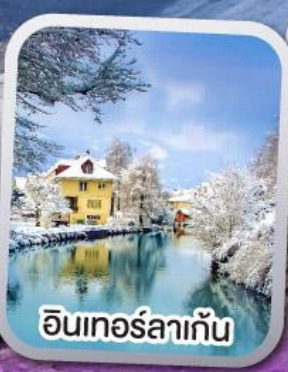
อินเทอร์ลาเก็น