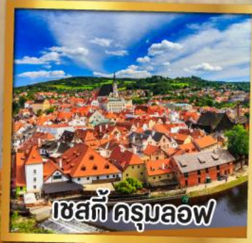
เชสกี ครุมลอฟ