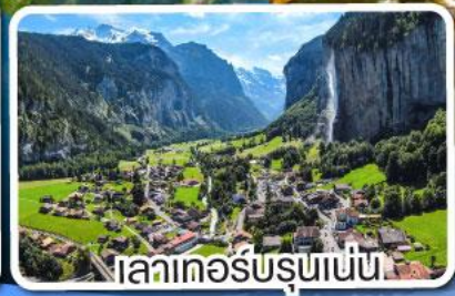
เลาเทอ์บรุนเนน