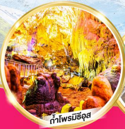
ถ้ำไฟมณีอุส