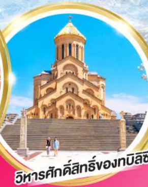
วิหารศักดิ์สิทธิ์ของทบิลีซี