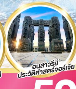
อนุสาวรีย์ ประวัติศาสตร์จอร์เจีย