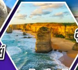
อุทยานบลูเมาส์แท่น