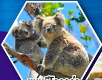
ชมหมีโคอาล่า ณ สวนสัตว์ซิดนีย์