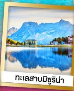
ทะเลสาบมิซูร์น่า