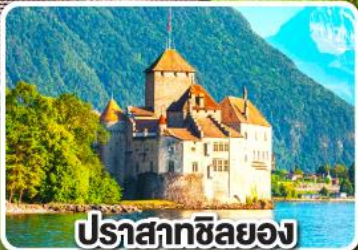
ปราสาทซิลยอง