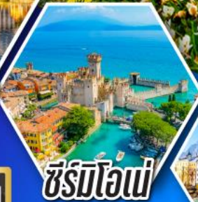
ซีร์มิโอนี