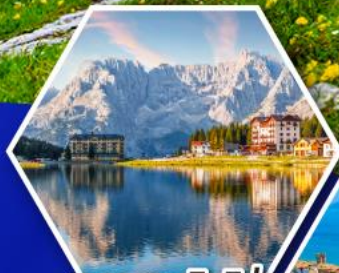
ทะเลสาบมิสุร์น่า