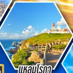
แควมไรอา