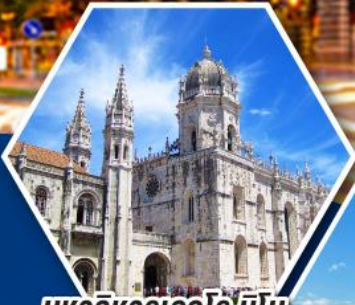
มหาวิหารเจโรนิโม