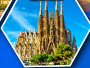
โบสถ์ซากราดา แฟมิลีย