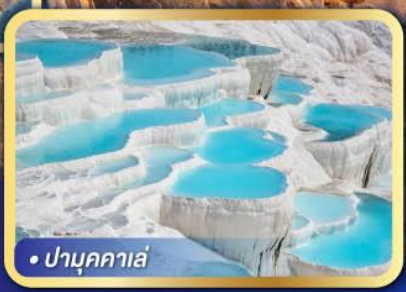
• ปามุกคาเล่