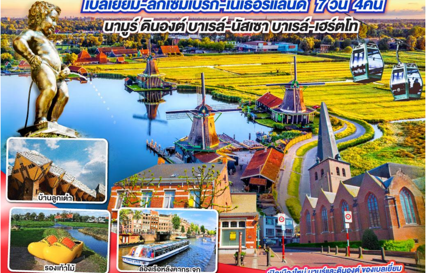
บ้านลูกเต๋

นามูร์-ดินองต์-บารส์-นัสซา-บารส์-เฮร์ตโท