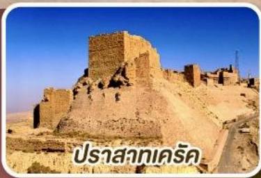
ปราสาทเคิร์ค