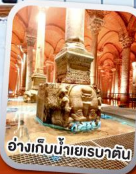
อ่างเก็บน้าเยเรบาตัน