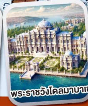
พระราชวังโดลมาบาเซ่