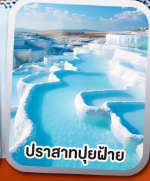
ปราสาทปุยฝาย