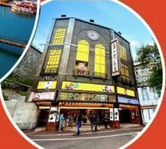
ร้าน POP MART ใหญ่ที่สุดในไต้หวัน