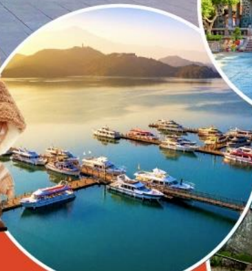
ทะเลสาบสุริยอินจันตรา