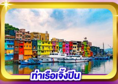
ท่าเรือเจิ้งปิ่น