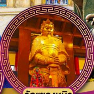
วัดเขangkหมิว