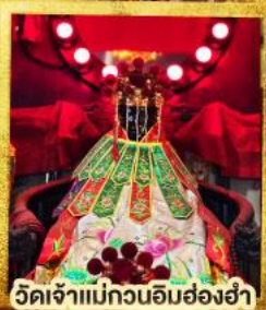
วัดเจ้าแม่กวนอิมสองฮ่า