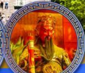
วัดกวนไท่