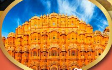
พระราชวัง สายลม