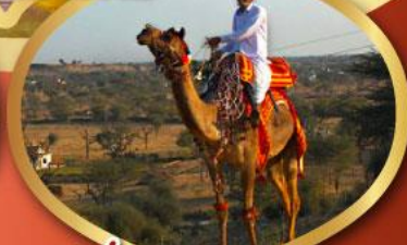
ฟรี ژیออู เมืองมันทวา ราคาเริ่มต้น