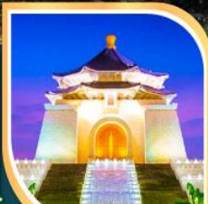
เจียงไคเช็ก