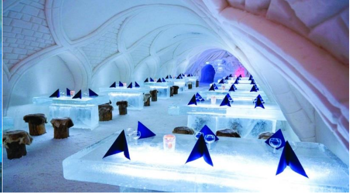
เที่ยง บริการอาหารกลางวัน ณ ภัตตาคาร