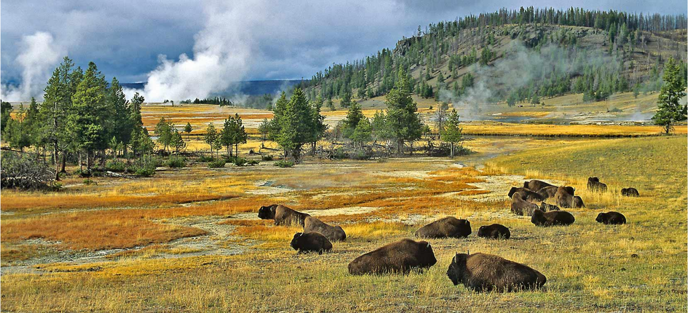
ใกล้เคียง

วันที่ห้าของการเดินทาง(5) เวสต์ เพลโด สโตน - อุทยานแห่งชาติแกรนด์ทีทอน เชอเนบ์ฟฟาโล่ บิลด์ - เมืองโคดี้