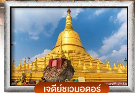
เจดีย์ชเวดากอง