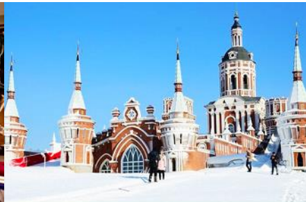
สวน LITTLE RUSSIA