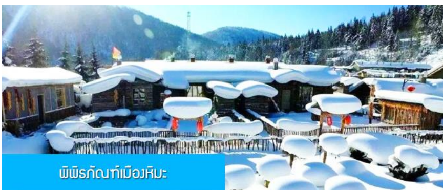
พืชรักบี้ที่เมืองหิมะ

หมายเหตุ การไปพักในเมืองหิมะทางทัวร์ไม่สามารถจัดรถทัวร์ไปส่งรถทัวร์ถึงหน้าโฮมสเตย์ได้ ทางคณะต้องนั่งรถเมล์หมู่บ้านเข้าไป โดยรถทัวร์ต้องถือหรือลากกระเป๋าเข้าที่พักด้วยตัวเอง เพราะโฮมสเตย์จะไม่มีพนักงานยกกระเป๋า มาคอยบริการยกกระเป๋าให้ผู้เข้าพัก ท่านควรจัดเตรียมกระเป๋าใบเล็กที่บรรจุเสื้อผ้า และเครื่องใช้จำเป็นสำหรับการพักแรม ณ โฮมสเตย์ในเมืองหิมะในคืนนี้ เพื่อสะดวกต่อการเคลื่อนย้ายกระเป๋า, และภายในห้องพักจะไม่มีผ้าเช็ดตัวผืนใหญ่ จะมีเพียงสบู่ แชมพูบริการทุกโรงแรม ท่านควรเตรียมแปรงสีฟันยาสีฟันติดไปด้วย