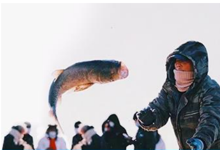
การจับปลาในฤดูหนาว

นำท่านชม การจับปลาในฤดูหนาว 冬捕 เป็นวิธีการจับปลาตามแม่น้ำและแหล่งน้ำในฤดูหนาวที่สืบทอดกันมายาวนาน โดยชาวบ้านจะนำแหดักปลามาวางดักไว้ตามจุดต่าง ๆ ก่อนที่ผิวน้ำจะปกคลุมด้วยน้ำแข็ง หลังจากผิวน้ำกลายเป็นน้ำแข็งแล้ว ชาวบ้านจะเจาะพื้นน้ำแข็งบริเวณที่มาแหวางดักอยู่เพื่อยกแหขึ้น จะมีปลาติดแหเป็นจำนวนมาก...พิเศษ ให้ท่านได้ชมการยกแหดักปลาจากสถานที่จริง และให้ท่านได้ชิมซุปรเนื้อปลาสด ๆ ที่ได้จากแหดักปลา