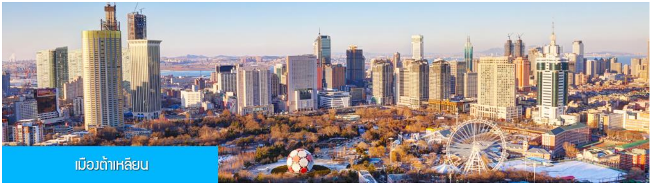
เมืองต้าเหลียน