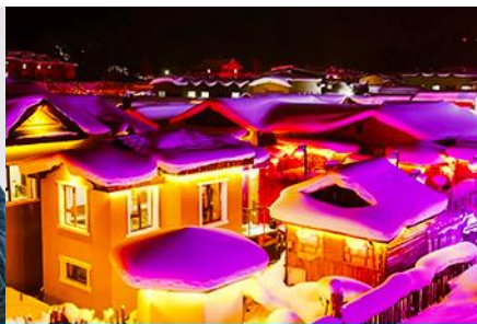
เมืองหิมะ Xue xiang