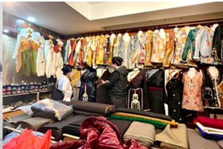
ศูนย์จำหน่ายอุปกรณ์กันหนาว