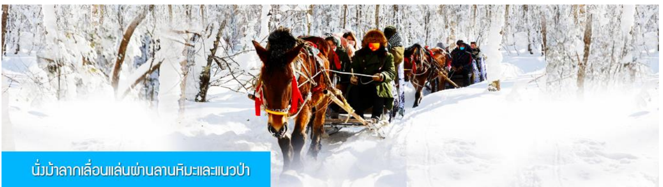
นั่งม้าลากเลื่อนเล่นผ่านลานหิมะและแนวป่า

รายการที่ 1 ระเบียบเดินชมวิว ภาพเขียนสิบลิ 冰雪十里画廊 เป็นการเดินชมวิวธรรมชาติตามเนินเขา ท่ามกลางแนวป่าที่มีต้นไม้ที่มีน้ำแข็งเกาะอยู่ตามกิ่งไม้ เป็นภาพวิวธรรมชาติฤดูหนาวที่สวยงามน่าประทับใจและพบได้เฉพาะในฤดูหนาวทางภาคอีสานของจีนเท่านั้น เวลาที่ใช้สำหรับ โปรแกรมเสริมนี้ประมาณ 1 ชั่วโมง อัตราค่าบริการ ท่านละ 220 หยวน หรือ 1100 บาท อัตรานี้รวมค่าบริการผ่านเข้าอุทยาน ค่ารถรับ ส่ง และค่าบริการของไกด์ท้องถิ่น และค่าบริการจัดการของบริษัททัวร์ท้องถิ่น.....หมายเหตุ โปรแกรมเสริมเป็นโปรแกรมที่ท่านต้องเสียค่าใช้จ่ายเองด้วยความสมัครใจ สำหรับท่านที่ไม่เข้าร่วมกิจกรรมดังกล่าวสามารถนั่งพักในรถได้