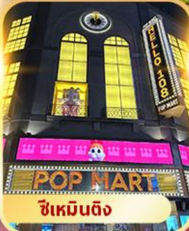
ซีเหมินติง