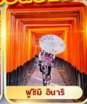
ฟูชิมิ อินาริ