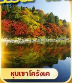
หุบเขาโคริงเค