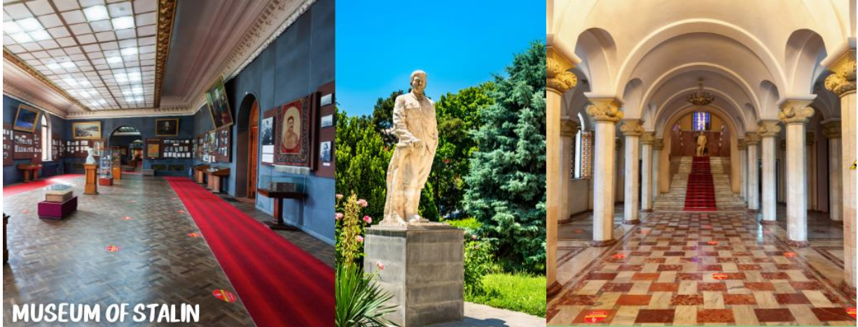
MUSEUM OF STALIN

นำท่านออกเดินทางสู่เมือง KUTAISI เป็นเมืองเล็กๆ ที่อยู่ระหว่างเมืองท่องเที่ยว UPLOSTSIKHE หรือ GORI และเมือง MESTIA (ใช้เวลาเดินทางประมาณ 2.30 ชม.)